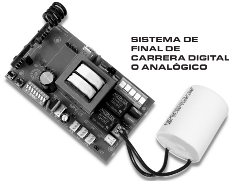
SISTEMA DE FINAL DE CARRERA DIGITAL O ANALÓGICO