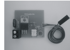
Módulo para Cerradura Eléctrica